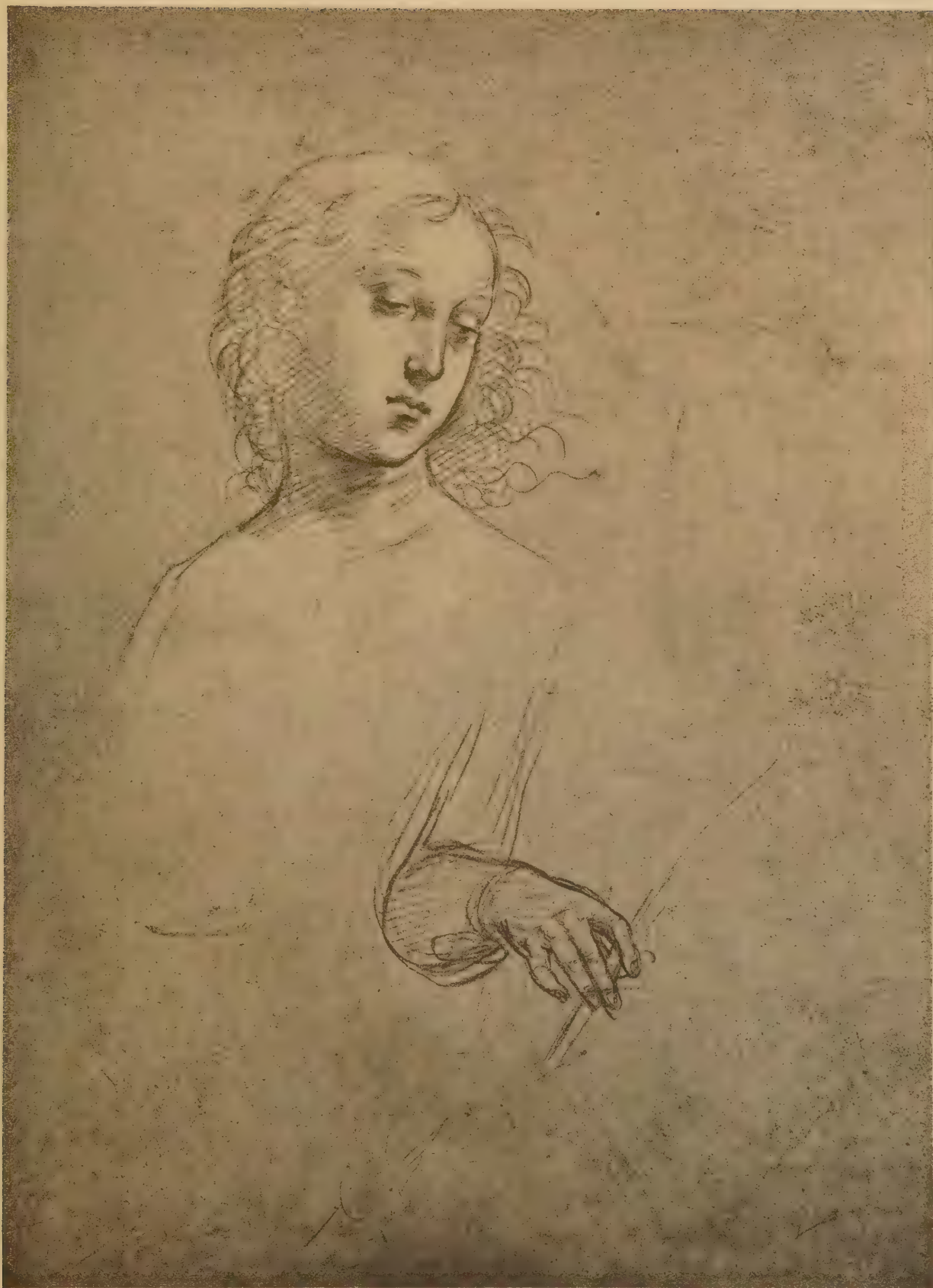
Etude pour le Couronnement - Ange jouant de la viole